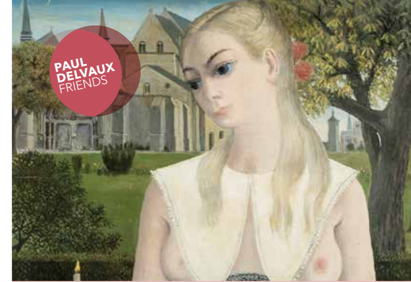
La petite mariée (detail), 1969, oil on wood, 74,5 x 62,3 cm