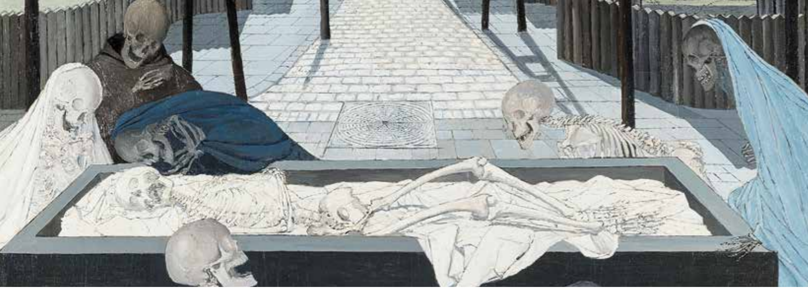
La mise au tombeau (detail), 1957, Oil on wood, 130 x 120 cm

NL Het PAUL DELVAUX MUSEUM in St. Idesbald nodigt u uit om in een ruimte van meer dan 1 000 m 2 kennis te maken met de schilderijen, aquarellen, tekeningen, schetsboeken en etsen die een overzicht geven van het werk van deze internationaal befaamde kunstenaar. U wordt ondergedompeld in een poëtische wereld met de vrouwen en geraamten, de neoklassieke architectuur en de treinen die zo typisch zijn voor de dagdream van deze even boeiende als verrassende kunstenaar.