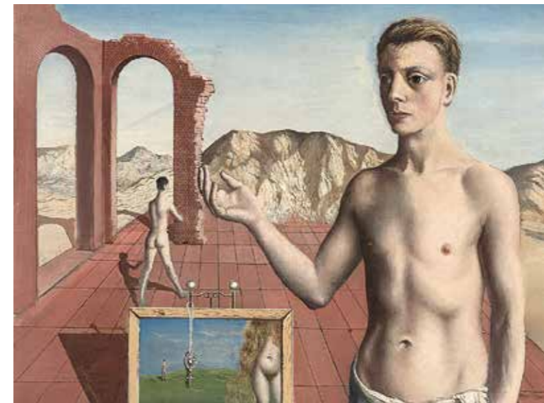
Le récitant (detail), 1937, oil on canvas, 70 x 80 cm

EN Teaching for 12 years at La Cambre, Paul Delvaux was always eager to pass his passion on to younger generations. As an extension of his work, the PAUL DELVAUX MUSEUM is assigning a space within its exhibition rooms to one contemporary artist every year, giving them the opportunity to be discovered by a wider public.